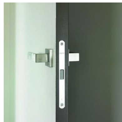
argenta® serrure magnétique avec fermeture au/à la de bain