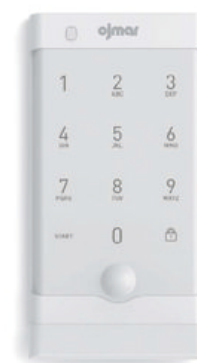
OCS*SMART Blanc prise de main