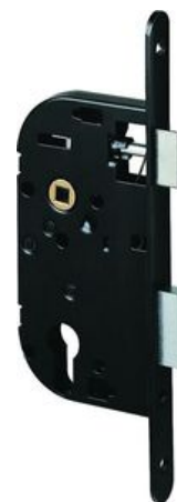
SERRURE 667 NF AXE à 40 ou 50