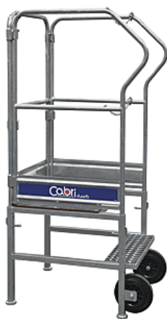
Plate-forme Cabri | DRB018