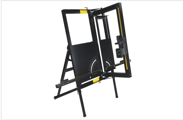
Table de decoupe au fil vibrant OSCILOCUT

Outillage électroportatif > Électroportatif > Scies > Scie à chaîne ou câble >