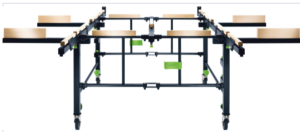
Table mobile de sciage et de travail STM1800

Manutention, levage et rangement atelier > Rangement atelier > Aménagement atelier > Servante d'atelier et établi >