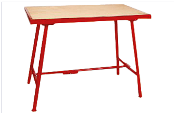
Table de monteur standard 2009

Manutention, levage et rangement atelier > Rangement atelier > Aménagement atelier > Servante d'atelier et établi >